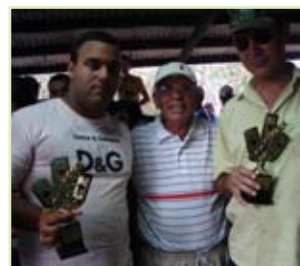
Atividades esportivas, futebol socite, jogo e torneio de truco.