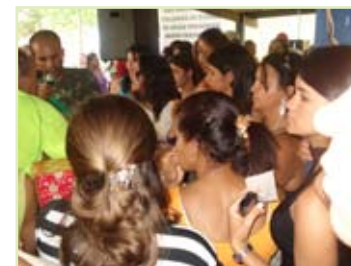
As jovens participaram de todas atividades, principalmente concurso de dança