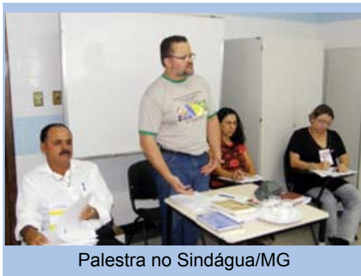
Palestra no Sindágua/MG

Participação em atividades da Universidade Federal de Juiz de Fora, ministrando palestra sobre Ética e Sindicalismo para sindicalistas