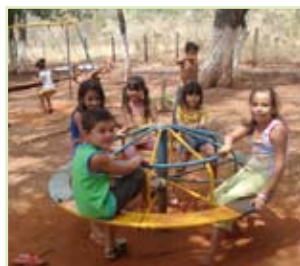
As crianças participam da recreação