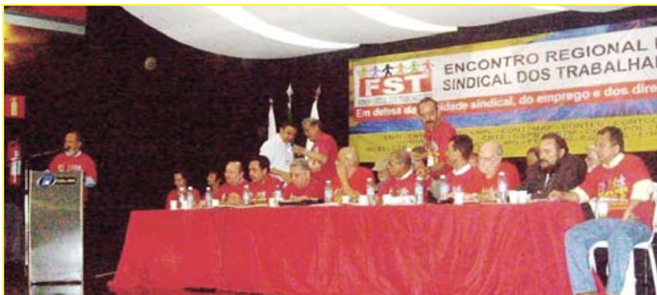
Encontro de Minas reuniu representantes de confederações e centrais sindicais

Agora, o Fórum irá realizar novos encontros em Santa Catarina (Joinville), Pernambuco (Recife), Bahia (Salvador), Sergipe (Aracaju) e Pará (Belém). Com massiva participação de dirigentes sindicais, os primeiros eventos regionais do FST reuniram mais de 3 mil pessoas, entre sindicalistas e trabalhadores.