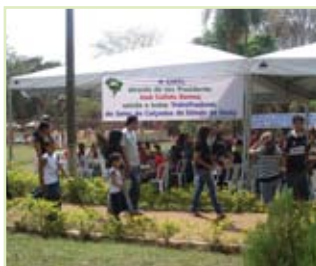
A CNTI homenageia os participantes

O evento, realizado no CETRI/GO, contou com a participação de cerca de 1.200 trabalhadores ligados ao setor