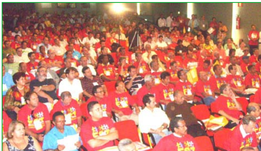
Encontro do FST em Minas que condenou a Contribuição Negocial

O combate aos juros altos vai entrar na pauta da 5ª Marcha a Brasília, que as centrais sindicais realizarão mais uma vez no final do ano. As centrais consideram a elevação dos juros o principal entrave para o crescimento, o desenvolvimento econômico e a geração de empregos.