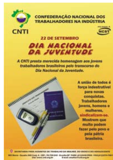
O cartaz da CNTI acima homenageia o Dia Nacional da Juventude

O evento contou com a realização de gincana envolvendo os temas abordados, demonstrando que a grande maioria dos jovens continuam otimistas em relação ao seu futuro e confiantes no seu potencial de cidadão para construir uma sociedade mais igualitária.