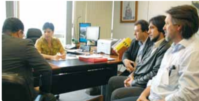
Reunião no TST

Fiquem atentos, manteremos todos informados e lutaremos para que se faça justiça!