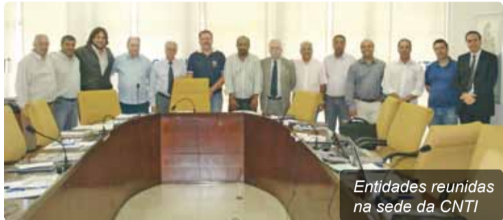
Entidades reunidas na sede da CNTI